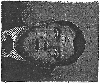
(подпис на притежателя)

ЗА ВИШЕ ОБРАЗОВАНИЕ НА ОБРАЗОВАТЕЛНО-КВАЛИФИКАЦИОННА СТЕПЕН МАГИСТЪР